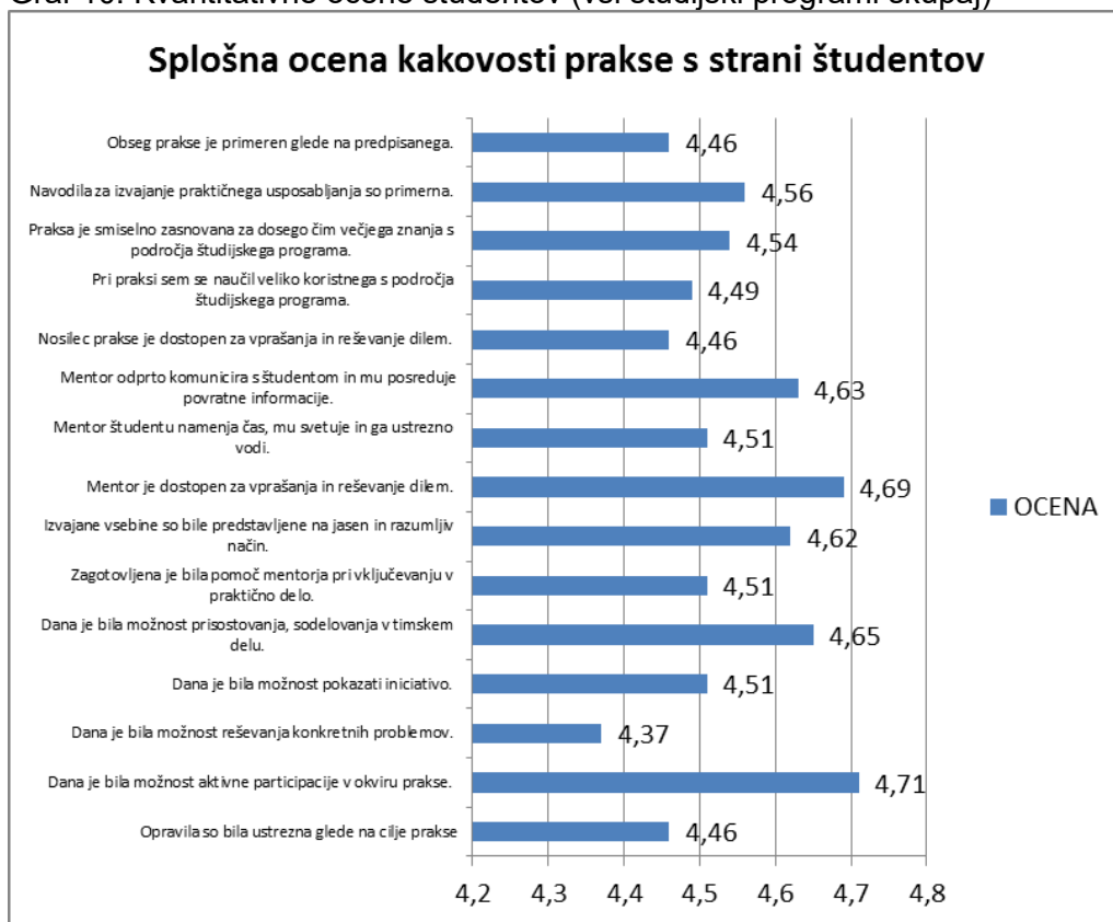
Graf 10: Kvantitativne ocene študentov (vsi študijski programi skupaj)

Spodaj so prikazane povprečne ocene različnih trditev o kakovosti prakse, ki so jih študentje ocenjevali z ocenami od 1 do 5.